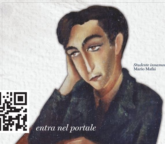
Studente innamorato Mario Mafai

Il portale sul patrimonio artistico custodito presso la Camera dei deputati